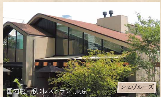
国内施工例：レストラン 東京