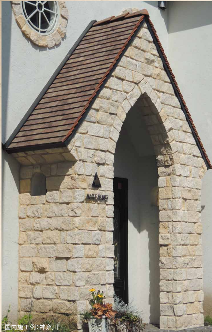
国内施工例：神奈川

ヨーロッパ北部では、元来、玄昌石のような天然石を幾重にも重ね合わせて屋根を葺いていました。プラットは、石屋根文化を受け継いだ伝統的な瓦で、北欧建築の象徴です。