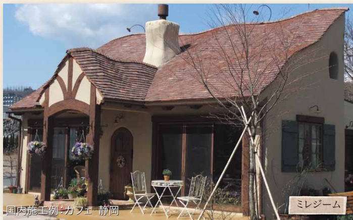
国内施工例：カフェ 静岡

経年により自然と欠けて横のラインが不揃いなアンティーク瓦の風合いを表現する為、数枚毎に全長が1cm短い瓦をランダムに混ぜています。また、表面の大胆なエイジング加工により、本格的な経年美を演出できます。