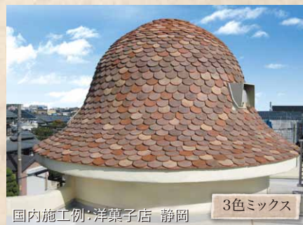
国内施工例：洋菓子店 静岡