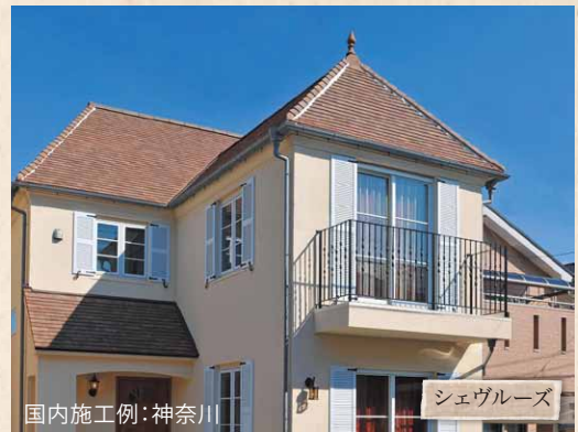
国内施工例：神奈川